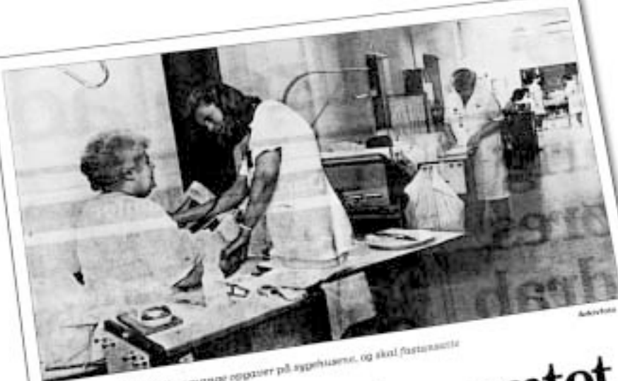
Medicinstuderende tar mange opgaver på sygehusene, og skal fastsætte mængde dem, koster det.